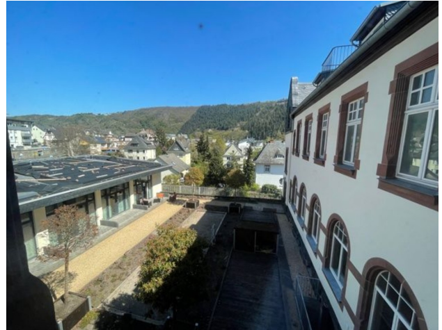
Whg. Nr. 12 - DG