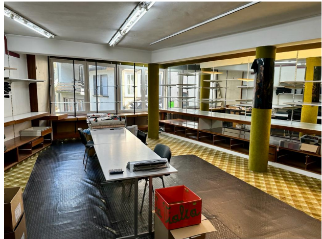
Geschäfts-/ Lagerfläche 2. OG