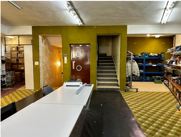
Aufzug und Treppenanlage 2. OG