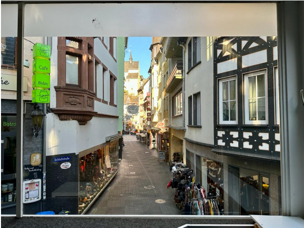
Ausblick in Richtung Marktplatz aus dem 1. OG