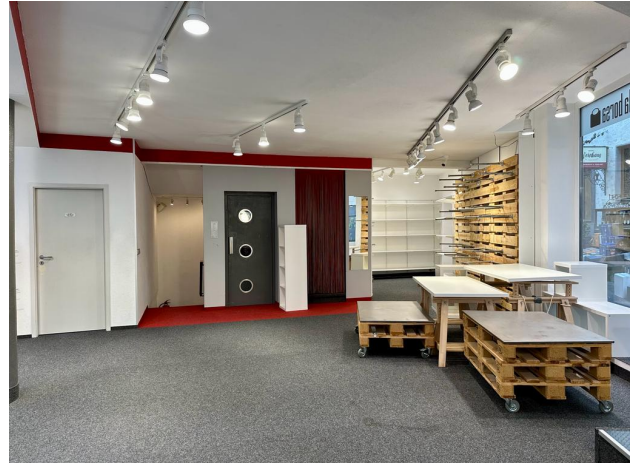
Aufzug und Treppenanlage 1. OG